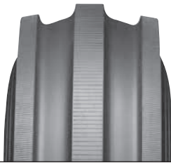
MULTI RILL (+)