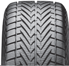
WINTRAC 4 XTREME