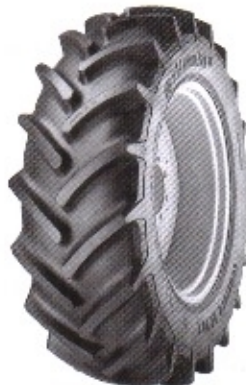
ContiContract AC 70 T