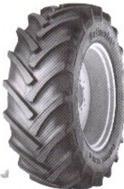
ContiContract AC 70 G