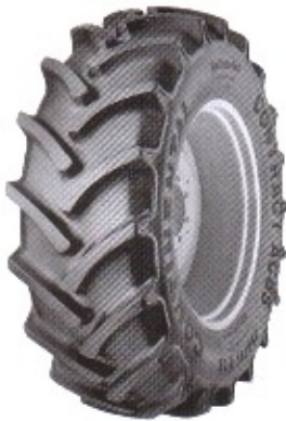
ContiContract AC 85